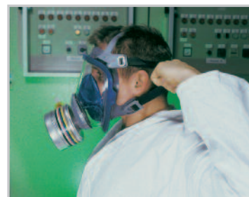
Spänn de två nedre banden