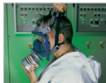
Dra bandstället över huvudet