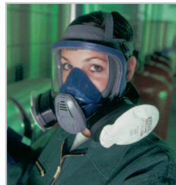
Advantage 3200 med TabTec och FLEXifilter

Dessa tre filterserierna används med Advantage 3200, Advantage 200 LS och Advantage 420.