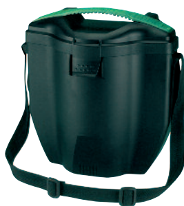
Advantage 3000 behållare