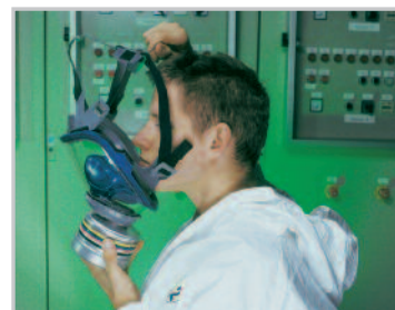
Sätt hakan i hakkoppen