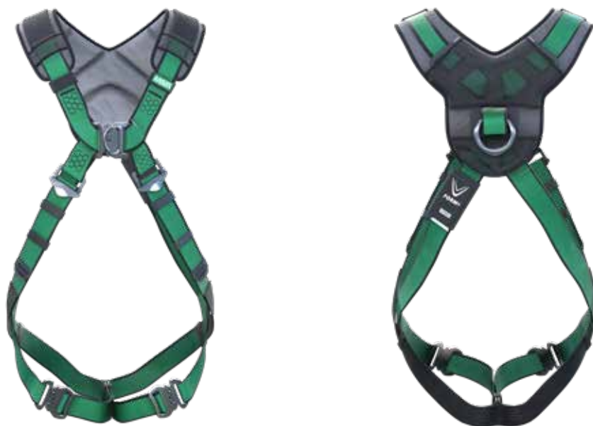
V-FORM+, D-ring bak/på brystet, Bajonettspenner (P/N 10206052)