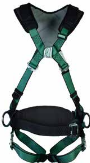
V-FORM+, D-ring bak/på brystet/hoften med hoftebelte, bajonettspenner (P/N 10206055)