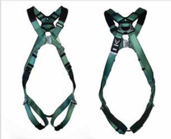
V-FORM, rygg D-ring, Qwik-Fit beinspinner (P/N 10205847)