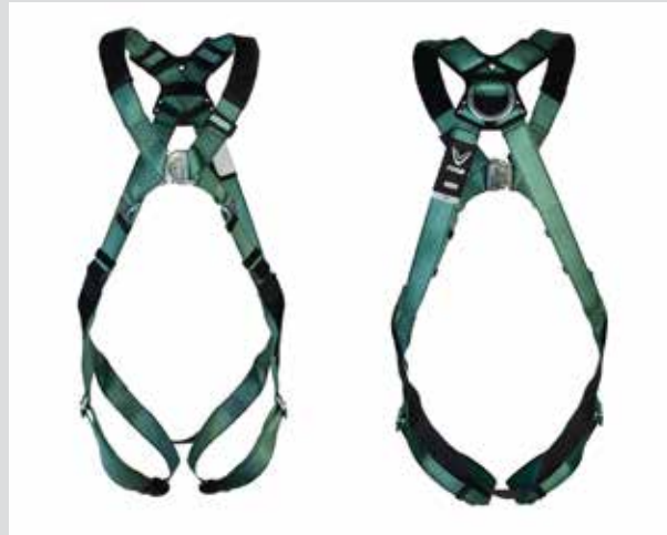
V-FORM, rygg/bryst D-ring, Qwik-Fit beinspinner (P/N 10205850)