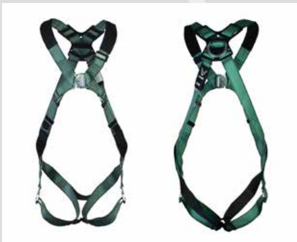
V-FORM, rygg/bryst D-ring, bajonettspenner (P/N 10206043)