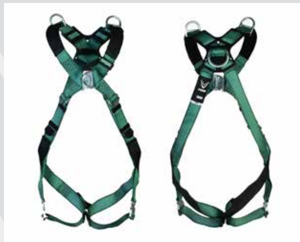
V-FORM, rygg/bryst/skulder D-ring, bajonettspenner (P/N 10206046)